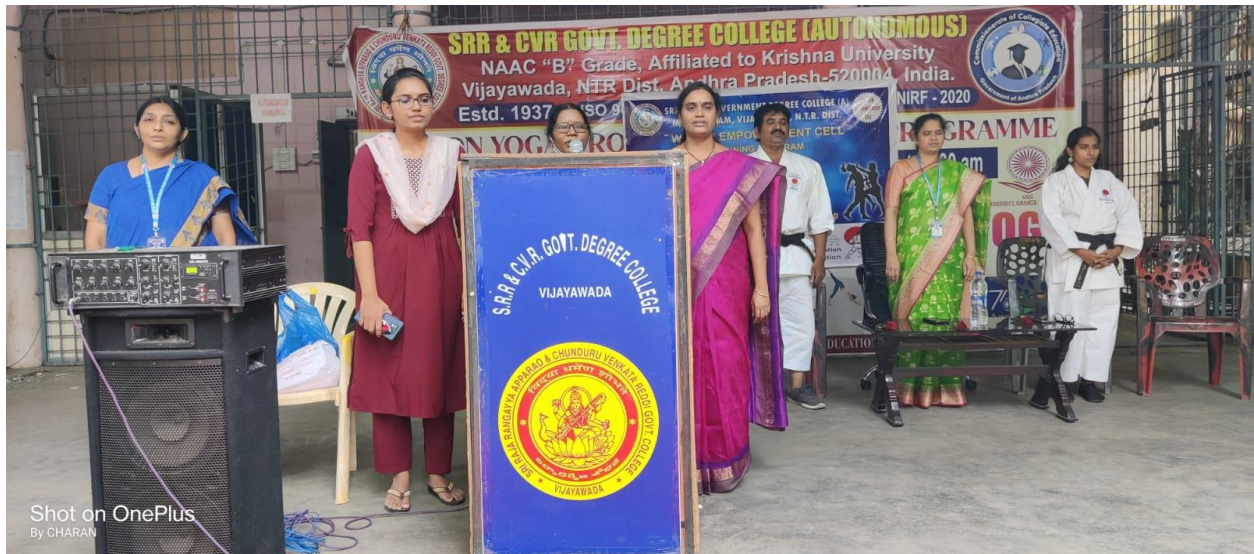
Shot on OnePlus By CHARAN